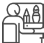
Diseño y proyectos